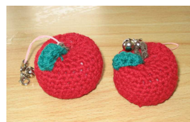
りんごのストラップ

本年も「希望の家」の諸活動につきまして、ご協力とご支援のほどよろしくお願い申し上げます。